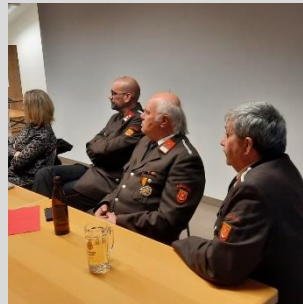
Bericht und Fotos: V Peter Weber