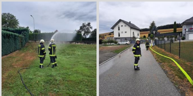
Bericht und Fotos: V Peter Weber

Nachdem die gestellten Aufgaben rasch und ohne Probleme abgearbeitet werden konnten, rückte die Mannschaft wieder ins FF-Haus ein.