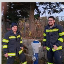
Bericht und Foto: V Peter Weber

Abschließend wurden noch organisatorische Aspekte im Zusammenhang mit dem bevorstehenden Rübenessen am 4. Dezember geklärt.