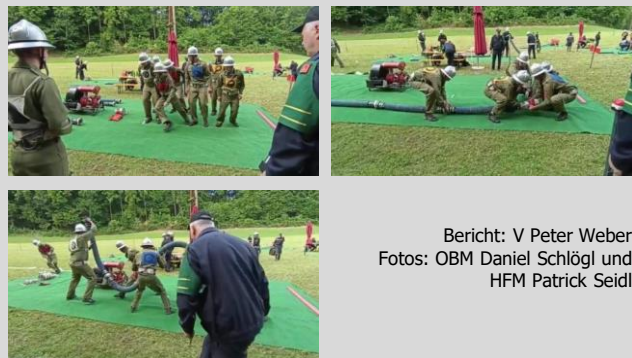
Bericht: V Peter Weber

Blendet man alle Folgen des „Blackouts“ aus, wäre der Löschangriff im Bewerb Bronze mit ca. 36 sec. (vermutlich fehlerfrei) beendet gewesen. Dies ist ein Hoffnungsschimmer für die 2022 anstehenden Bewerbe auf Bezirks- und Landesebene.