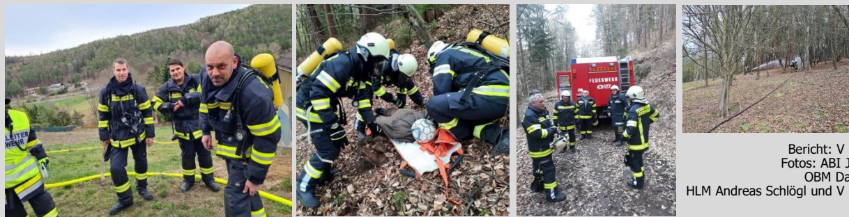
Bericht: V Peter Weber

Im Rahmen der abschließenden Übungsbesprechung zeigten sich sowohl die Abschnittskommandanten ABI Josef Weber, ABI Reinhold Stifter und auch der Vizebürgermeister mit dem Inspizierungsverlauf zufrieden.