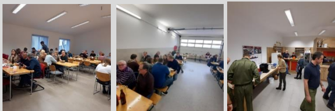
Bericht und Fotos: V Peter Weber

Wir bedanken uns bei allen Besucher:innen und hoffen auf ein Wiedersehen bei einer unserer Veranstaltungen im Jahr 2023!