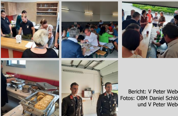
Bericht: V Peter Weber

Kurz vor Beginn der hl. Messe wurde die FF Lebenbrunn zur Beseitigung eines Sturmchadens (Feldgasse/oberhalb Hochbehälter) alarmiert. 3 Kameraden rückten mit dem TLF-A aus. Vor Ort stellte sich jedoch heraus, dass es sich um einen Fehlalarm handelte.