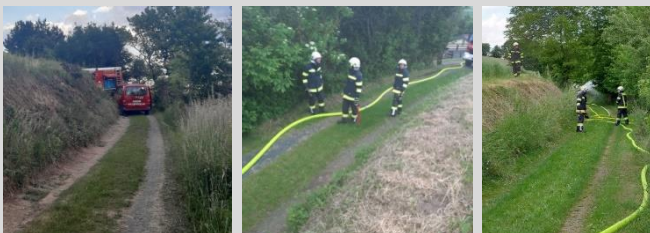
Bericht: V Peter Weber Fotos: OBM Daniel Schlögl und V Peter Weber

Im Anschluss an die Übung wurden noch die Weichen (Arbeitseinteilung für den bevorstehenden Kirtag (Pfungstmontag) gestellt. Nachdem die FF Lebenbrunn - nach 2-jähriger Zwangspause - diesen wieder ausrichten wird, wurde im Rahmen der an die Übung anschl. Besprechung u.a. die Arbeitseinteilung erstellt.