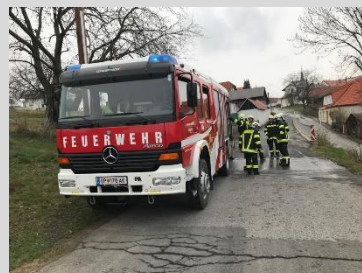
Bericht: V Peter Weber