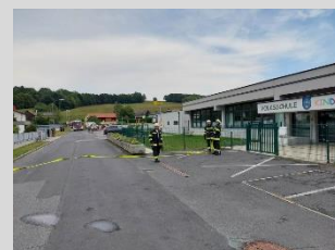
Bericht: V Peter Weber