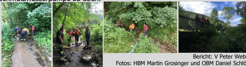
Bericht: V Peter Weber

Die Mannschaft rückte mit dem TLF-A und dem MTF aus. Es erfolgte die Reinigung der Saugstelle im Bereich der Adresse Rotleiten 5 sowie jener an der Hottergrenze zum Ort Steinbach. Durch Augenschein konnte festgestellt werden, dass sich beide Saugstellen in gutem Zustand befinden. Die Reinigungsaktion wurde auch dazu genutzt den Umgang mit der Schmutzwasserpumpe zu üben.